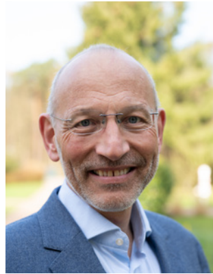
Peer Gent Vorsitzender