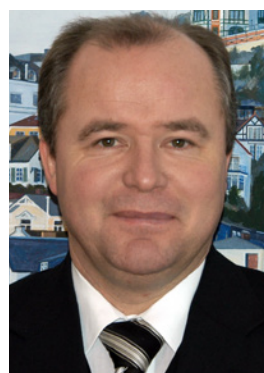
Nils Seemann Bestatter, Beerdigungsinstitut „Seemann & Söhne KG“, Hamburg