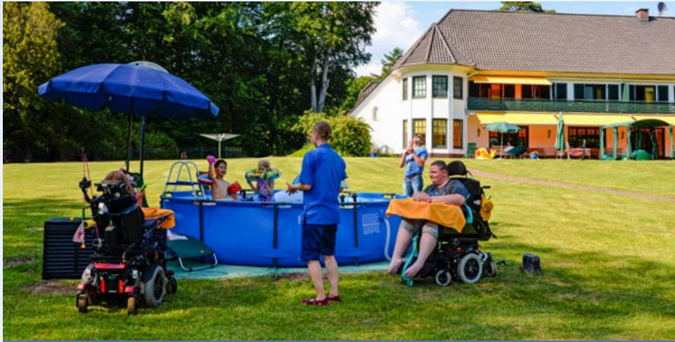
Gemeinsames Planschen in unserem Pool

Für ein Haus, in dem Hilfe, Unterstützung, Mitmenschlichkeit und Zuwendung wichtiger Inhalt der täglichen Aufgaben sind, ist die Pandemie eine große Herausforderung.