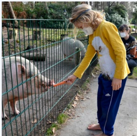
Fütterung unserer Schweine