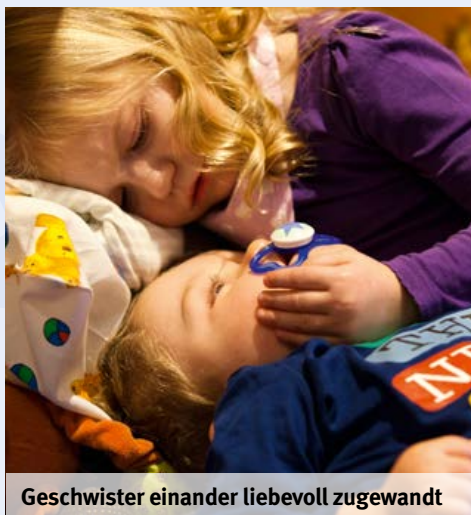
Geschwister einander liebevoll zugewandt

Streit zwischen dem Bruder und der Mutter mitbekam, hatte es das Gefühl von Schuld und sagte: „Das ist alles erst, seit ich krank bin...“. Um dem erkrankten Kind zu helfen, müssen wir die ganze Familie sehen. Sie ist das Netz, das das Kind auffängt.